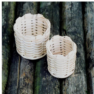
Bleistiftständer ab 4 Jahren Flechtzeit ca. \frac{1}{2} Std