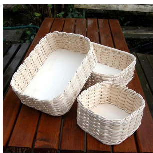
Regalkorb gerundet ab 8 Jahren Flechtzeit ca. 1 Std