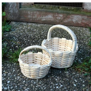
Minikorb rund ab 6 Jahren Flechtzeit ca. \frac{1}{2} Std