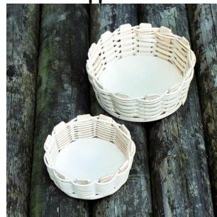
Zuckerlkörbe ab 4 Jahren Flechtzeit ca. \frac{1}{2} Std