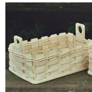
Schafferl eckig ab 6 Jahren Flechtzeit ca. \frac{1}{2} Std