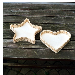
Stern groß oder Herz groß ab 8 Jahren Flechtzeit ca. \frac{1}{2} Std