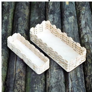
Bleistiftschalen ab 4 Jahren Flechtzeit ca. \frac{1}{2} Std