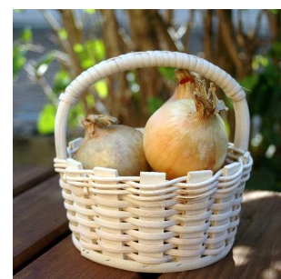
Zwiebelkorb ab 8 Jahren Flechtzeit ca. \frac{1}{2} Std