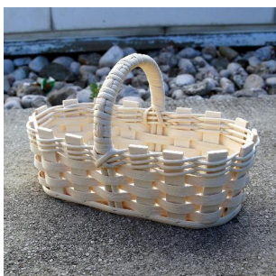
Kinderkorb oval ab 6 Jahren Flechtzeit ca. \frac{1}{2} Std