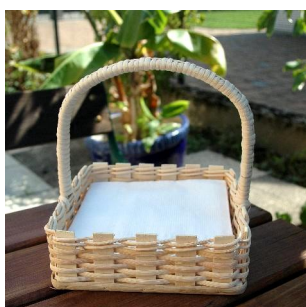
Serviettenkorb ab 8 Jahren Flechtzeit ca. \frac{1}{2} Std