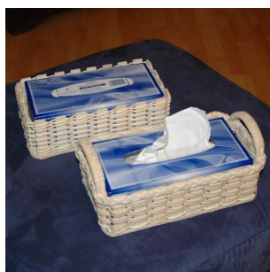
Taschentücherbox ab 6 Jahren ohne Griffe ab 8 Jahren mit Griffen Flechtzeit \frac{1}{2} - 1 Std