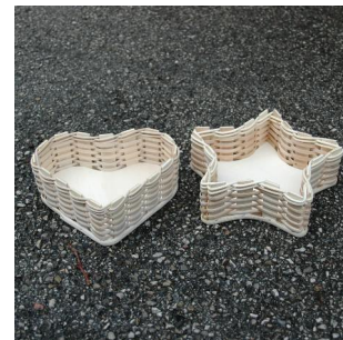
Herz klein oder Stern klein Herz ab 4 Jahren Stern ab 6 Jahren Flechtzeit ca. \frac{1}{2} Std