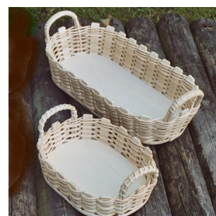
Brotkörbe oval ab 8 Jahren Flechtzeit ca. 1 Std