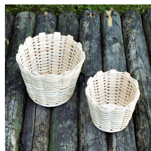
Blumenübertopf ab 6 Jahren Flechtzeit ca. \frac{1}{2} Std