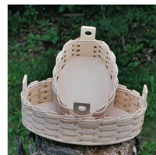
Schafferl ab 8 Jahren Flechtzeit ca. \frac{1}{2} Std